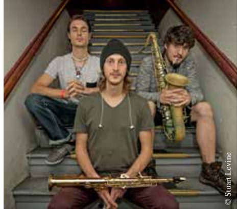
Moon Hooch, groupe de jazz fusion.

Tarifs : adhérent gratuit ; adhérent autres salles 8 € ; location 12 € ; sur place 14 €.