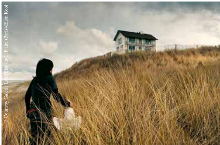
Ellen Kooi, collection du Musée de La Roche-sur-Yon.

● Espace d'art contemporain du Cyel, 10, rue Salvador-Allende – La Roche-sur-Yon