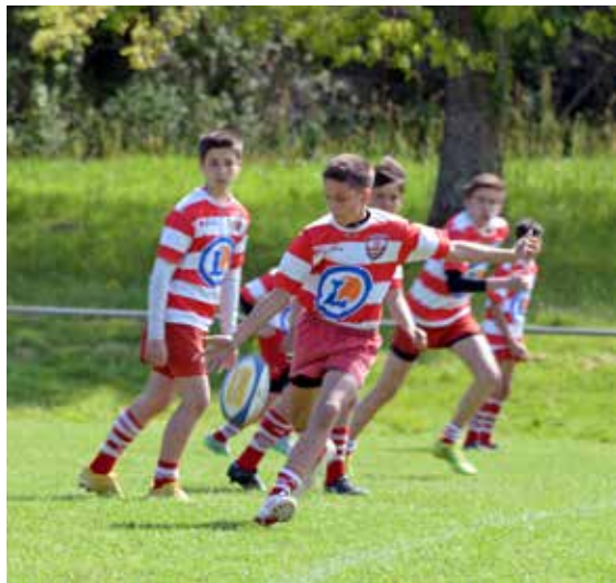
Participez à la fête de l'ovalie.

● Complexe sportif des Terres-Noires – La Roche-sur-Yon, à partir de 9 h Contact : 02 51 36 24 38 et sur www.fcyrugby.com