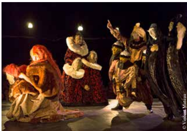
Ivan le Terrible par le Théâtre du Rugissant.

● Le Manège – La Roche-sur-Yon, le lundi à 20 h 30 et le mardi à 19 h Contact : 02 51 47 83 83 et sur www.legrandr.com