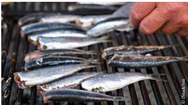
Les sardines grillées seront de la fête !

Deux bars et 320 m 2 de barnum complèteront le décor. Comme chaque année, de nombreuses animations sont prévues dès 18 h, dont un espace entièrement destiné aux enfants. Sans oublier les sardines, grillées bien sûr !