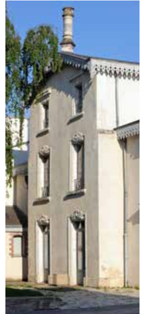
La Maison Gueffier.

● Maison Gueffier, esplanade Jeannie-Mazurelle – La Roche-sur-Yon, à 12 h 45 Contact : 02 51 47 48 35 et sur www.legrandr.com/participez/article/les-jeudis-curieux