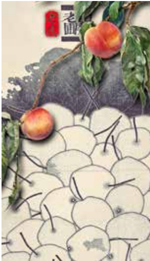
© Bai Jin Hai Poires de la montagne , 2017 & Pierre-Yves Gervais Les pêches , 2015

L'École d'art de La Roche-sur-Yon présente les travaux d'un duo franco-chinois d'artistes.