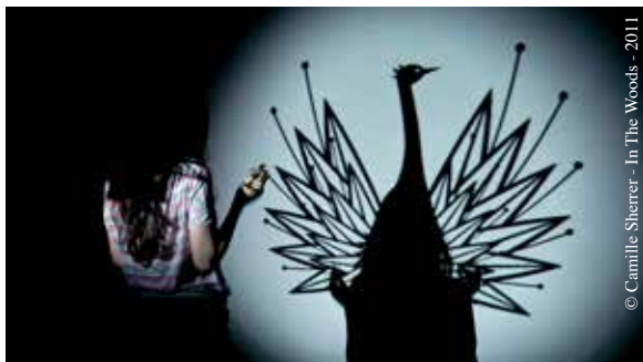
© Camille Sherrer - In The Woods - 2011